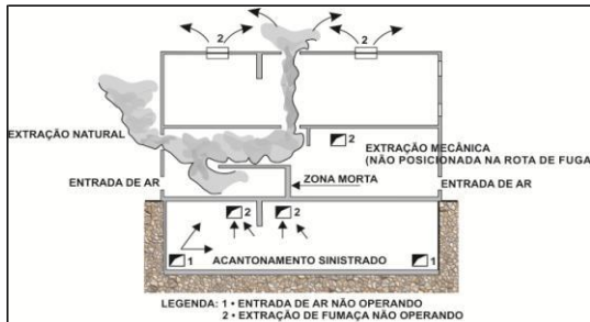
Figura 2 - Zonas mortas

b. extração adequada da fumaça, não permitindo a criação de zonas mortas onde a fumaça possa vir a ficar acumulada, após o sistema entrar em funcionamento (ver fig 2);